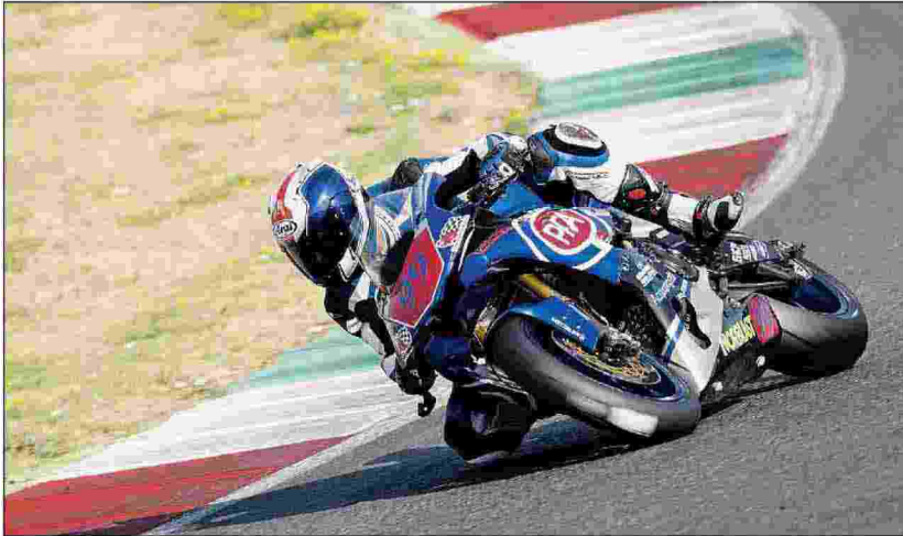
I Rapaci in pista