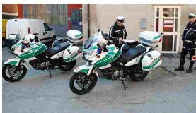
Urta ciclista e ...