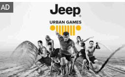
Scopri i Jeep Urban Games

Il vero sprint per il tuo business: Fibra e chiamate illimitate da 45€/mese.