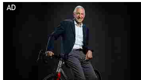
Wind Tre Business

Fino all'8 settembre tanti prodotti in offerta. Sfoglia il volantino online