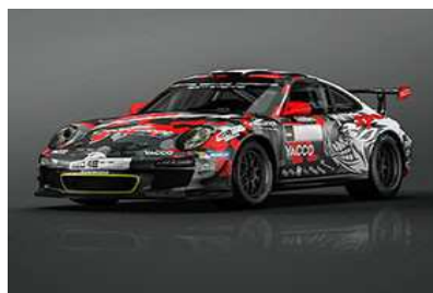
WRC - Tour de Corse - Nuova Livrea della Porsche di Romain Dumas